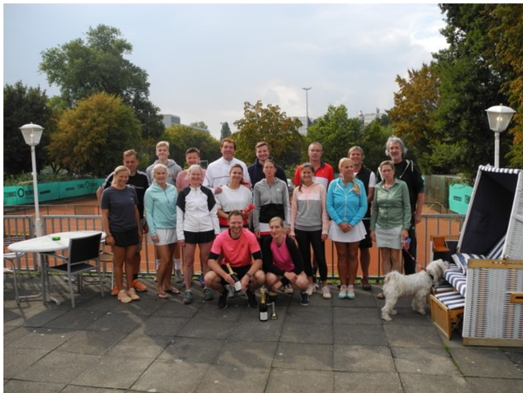
Mixedmeisterschaften 2019 beim HSC